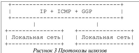
Рисунок 3 Протоколы шлюзов

Для фрагментирования длинной дейтаграммы IP модуль IP (например, на маршрутизаторе) создает две новых дейтаграммы IP и копирует содержимое полей заголовка из длинной дейтаграммы в заголовки обеих новых дейтаграмм. Данные исходной дейтаграммы делятся на две части по 64 битовой (8 октетов) границе. Вторая часть дейтаграммы может иметь размер, не кратный 8 октетам (64 битам), но первая часть должна содержать целое число 8-октетных блоков. Назовем число 8-октетных блоков в первой части дейтаграммы NFB (Number of Fragment Blocks – число блоков фрагментации). Первая часть дейтаграммы помещается в первую из новых дейтаграмм IP и поле длины устанавливается в соответствии с длиной первой дейтаграммы. Для первой дейтаграммы устанавливается флаг наличия дополнительных фрагментов. Вторая часть данных помещается во вторую из созданных заново дейтаграмм и поле размера устанавливается в соответствии с длиной новой дейтаграммы. Значение поля смещения увеличивается на величину NFB. Значение флага наличия дополнительных фрагментов сохраняется в соответствии с флагом исходной нефрагментированной дейтаграммы.