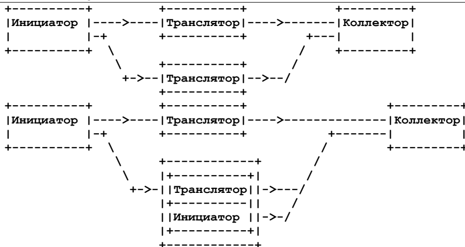
Рисунок 2. Некоторые варианты развертывания syslog.